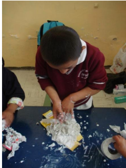
Kevin 9 años de edad Técnica: Papel maché