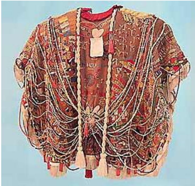
Capa de la Presentación Tejido e hilo. 118.5 x 141 x 20 cm.