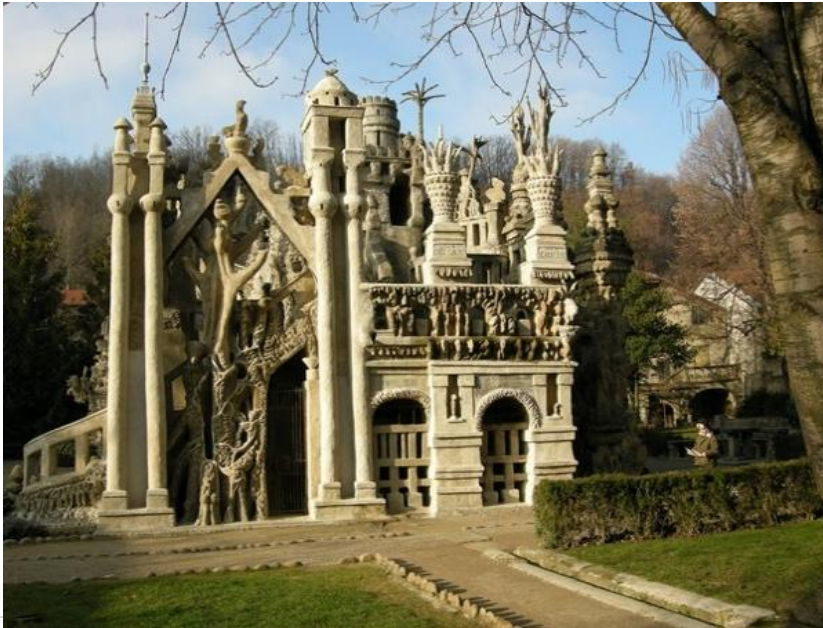
El Palacio Ideal 30 pies de alto Piedra Hauterives - Francia