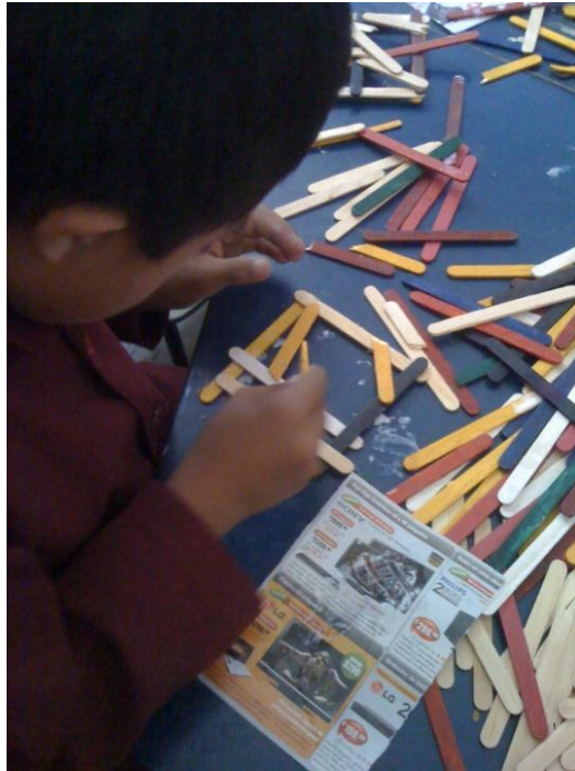
Martín 10 años de edad Técnica: Montaje