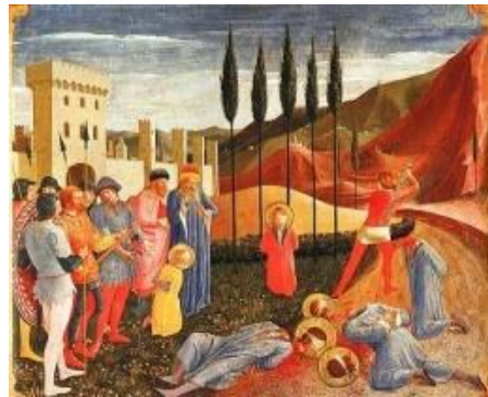
Decapitación de los santos Cosme y Damián. Fray Angélico (1440)

Claro está, que el artista no solo a tratado la temática religiosa sino que ha explorado muchos campos sociales con respuesta a las atrocidades de los crímenes y penalización de muerte.