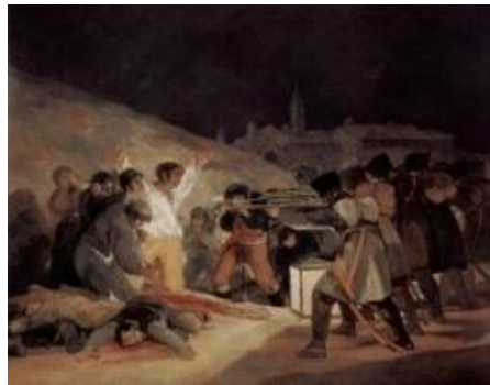
Los fusilamientos del 3 de mayo 1808. Francisco de Goya Museo del Prado (1814)

La obra de Goya, titulado Los fusilamientos de Moncloa, refleja la violenta represión francesa a los españoles altivos frente a la invasión de Napoleón el día 3 de Mayo de 1808. Obra que marca unos ítems en la independencia y la defensa de la libertad del pueblo español, hoy considerado como un referente contra guerra y sus consecuencias. 8