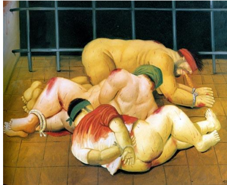
El dolor de Abu Ghraib (2005), Fernando Botero.

Botero ha criticado la violencia, la muerte de la guerra y el narcotráfico en Colombia y los abusos del poder político de Norteamérica.