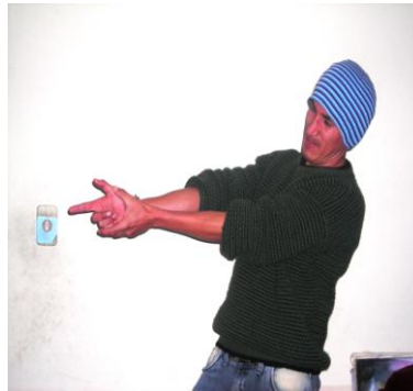
Imagen final a ser dibujada y pintado en el lienzo.