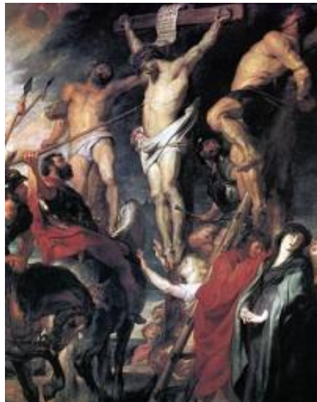
Cristo en la cruz, Petrus Pacules Rubens (1620)

Estos y otros genios de la pintura, han interpretado esta temática con respecto a la pena de muerte y la imaginación de estos pintores han redimido los momentos crueles en muchas obras como la crucifixión de Cristo, en la cual el trazo ondulante y la impresión de la luz empleados en esta obra, caracterizan el trabajo de Petrus Paulus Rubens y de Diego Velázquez titulado La Crucifixión, obra que se atribuye a la pena de capital pero sensibiliza al hombre cuando la ve, Velázquez hace alarde de maestría y consigue que el espectador pueda captar la belleza corporal y la serena expresión de la figura.