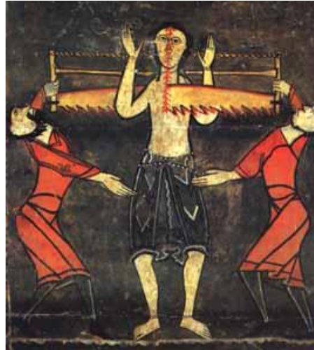
Martirio de San Quirico (primera mitad del siglo XII). Anónimo, Museo Nacional de Arte de Cataluña.