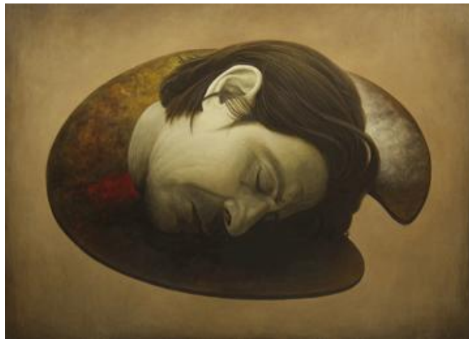
Autorretrato como Juan Bautista, Jorge Velarde, óleo sobre tela, 145 x 200 cm, 2008

El arte contemporáneo en el Ecuador se ha manifestado de forma progresiva en todos sus niveles. Podemos hablar del linaje surrealista del pintor Jorge Velarde (1960) artista Guayaquileño, "el pintor anula esquizofrenia y lúdicamente su personalidad, su unicidad para multiplicarse en pluralidad de personajes (santos, dragón, mártir, peleador de lucha libre, traga espadas, tzanza, jíbaro) en sus autorretratos." 22