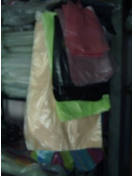
"Fundas plásticas", registro fotográfico del "Bazar Rosita", Cuenca, Ecuador, 2010

"En el reino de lo efímero, todo se convierte inmediatamente en chatarra para que bien se multipliquen la demanda, las deudas y las ganancias, las cosas se agotan en un santiamén, como las imágenes que disparan la ametralladora de la televisión y las modas y los ídolos que la publicidad lanza al mercado". 9