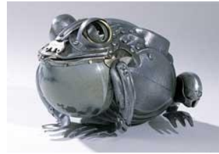
Eduard Martinet, "animales metálicos", "lata y hierro reciclado", 2009