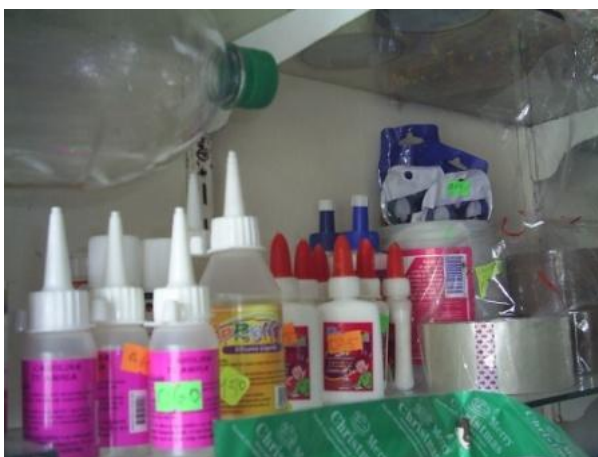
“Elementos escolares”, registro fotográfico del “Bazar Rosita”, Cuenca, Ecuador, 2010

Úselo y Tírelo. Las descripciones que se le da al desarrollo de la humanidad es totalmente coherente con la realidad, más que un análisis es una protesta contra las mafias que se mueven en los países desarrollados, las grandes empresas, fabricas y comercializadoras; la realidad misma está más cercana de lo que pensamos. Y cuando hablamos de necesidades estamos hablando de países tercermundistas y por ende es una puerta abierta para la oferta de productos de bajos costos pero el grado de consumo es por esta razón es bien elevado, a veces nosotros llegamos a consumir más