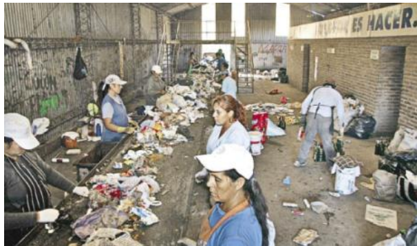
Solar Power Free Ebooks and Magazines, campaña de reciclaje, 2007

Enfocando el tema del reciclaje, su valor, su aporte al respeto de la vida sobre el planeta. El tema a desarrollar va dentro de este marco, enfatizando el arte como trascendencia y sus rol dentro de una sociedad.