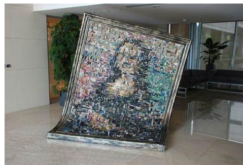
Mona Lisa, lobby de las oficinas de ASUS EN Peitou, Taiwan. Tarjetas madre (motherboards) de computadoras recicladas

Ahora, si bien los objetos reciclados se reutilizan de forma directa, tenemos que tomar en cuenta que en el reciclaje existe un proceso de recolectar para convertir u obtener un nuevo producto.