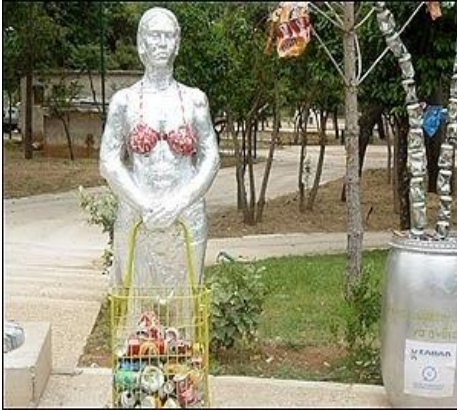
“De compras”, escultura con plástico reciclado, Reciclando en espiral, 2006