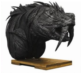
Esculturas con "neumáticos reciclados", "Robot Nine", 30 noviembre, 2009 Álbum: "Arte Distinto", Crecimiento y Ecología