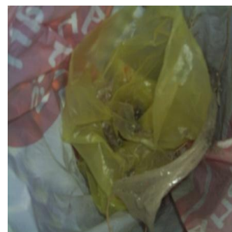
“basurero interior”, registro fotográfico del “Bazar Rosita”, Cuenca, Ecuador, 2010

Una alternativa nueva y muy creativa ante una realidad de usos y hábitos dentro de la sociedad, ahora bien, es una propuesta diferente y sobretodo que se encuentra dentro de la contemporaneidad del arte, pero en este concepto de contemporaneidad del arte cabe destacar que según la tesis empleada por el Mst. Manuel Guzmán que el arte contemporáneo en contraste con el “gran mundo del arte” o vanguardias la gente común siempre quiere estar o sentirse identificada y en este aspecto el arte contemporáneo es solo para las elites, puede ser comprendido por unos pocos de diferente manera tanto de interpretación y comprensión mediada dentro de lo conceptual, pero en relación a esto se dice que le tememos a lo desconocido y en esta época genera un poco de desconcierto al saber que la gente al no saber o no entender lo que tienen al frente simplemente lo rechazan, pero esto también exige o más bien ha hecho que los artista se hagan poco menos creativos en relación a lo que se muestra, pero este punto de vista planteado en esta tesis es fiable y constatada en la realidad artística y sobretodo la temática y la técnica que se trata en este análisis es un punto a favor para que la contemporaneidad en el arte sea un poco más creativa y no caiga en obras simples y desemboque en eternas charlas.