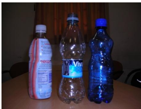
Registro fotográfico de envases plásticos de diferentes bebidas, Danny Narváez, 2010.

El plástico como material reciclable, está dentro de los elementos más difíciles en descomponerse. El término plástico en su significación más general, se aplica a las sustancias de distintas estructuras que carecen de un punto fijo de ebullición y poseen durante un intervalo de temperaturas propiedades de elasticidad y flexibilidad que permiten moldearlas y