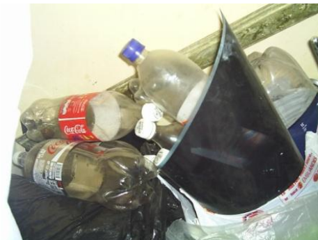
"Elementos reciclados plásticos", registro fotográfico del taller "El Mono", Cuenca, Ecuador. 2010

que a diario vivimos plástico en las diferentes áreas del consumo, al menos el saber que se recicla para obtención de productos como casacas o cualquier otra vestimenta, elementos de decoración o elementos para el hogar, existe otra realidad la cual nos exige un poco más de conciencia como en elementos de fácil acceso como son la bebidas gaseosas o el agua en botella o una más fácil las fundas o bolsas de supermercado ya que estos elementos de material plástico que se consume a diario son económicos, livianos, transparentes, en fin hacen más práctica la vida , en cuestión están creando varios problemas y bien serios al medio ambiente, la gran mayoría se convierte en basura luego de haberlos usado, entendamos que no son biodegradables y ese es el gran problema.