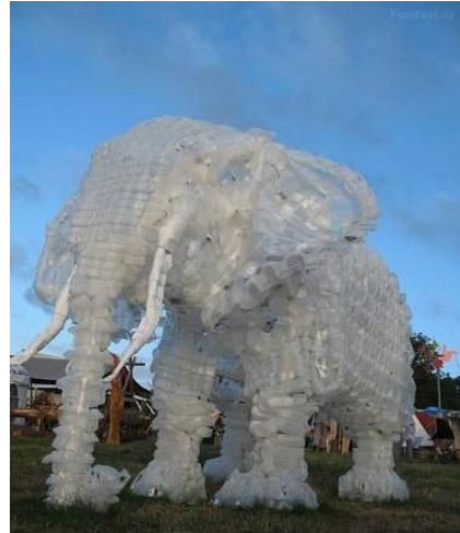
Elefante con botellas recicladas http://corcholat.com/!N5P , 2010

La presencia de los símbolos, la cual se dice que “lo simbólico representa el significado” 4 esa es la razón en la que trasciende el arte conceptual como forma de expresión de una época, por las diversas inconformidades a través de la historia, por la que muchos artistas en la época contemporánea crean su propio mundo de representaciones dentro del arte, utilizando como en este caso material reciclable. Arte y reciclaje, creatividad a flor de piel.