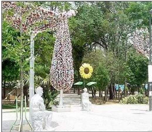
“De compras”, escultura con plástico reciclado, Reciclando en espiral, 2006

Son muchos los ejemplos de artistas que crean sus obras utilizando los residuos y desechos de