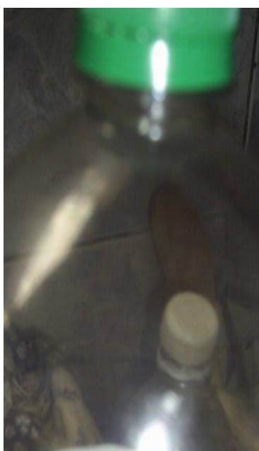
“botellas plásticas”, Danny Narváez, fotografía digital, Cuenca, Ecuador, 2010

Cuenca ha sido desde siempre catalogada como una ciudad turística y culturalmente activa, con gente amable y hospitalaria que por ende se debe cuidar su imagen y mantenerla sobretodo aun buen nivel, ahora durante el mes de noviembre del 2010 se vinieron realizando encuestas que giran alrededor de la basura, las apreciaciones obtenidas son las siguientes: existe campaña de reciclaje hace algunos años atrás por parte de la empresa municipal EMAC, las cuales las realizan en fundas o bolas de color celeste, ahora, muchas personas dueñas de locales comerciales y restaurantes, manejan