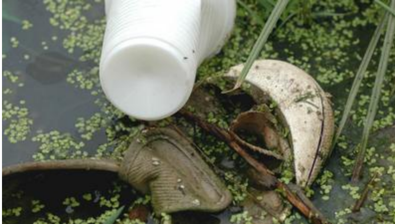
Registro fotográfico, "basura local", Machala, Ecuador, año 2006

Es interpretada como la evolución y cambio de las diferentes estéticas que acompañan e intentan interpretar críticamente las conflictivas transformaciones de la civilización industrial, lo residual tiene una gran importancia. Transformar