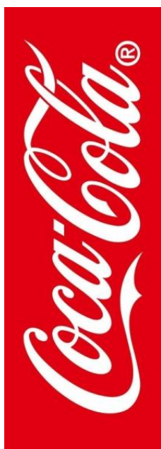
Logotipo Coca-Cola, Marketing, 2010