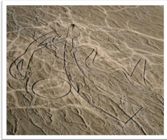
Andrew Rogers, «the Rhythms of Life», Gobi Desert, 200m x 200m, año 2006

Consecuente del tema: “La perdurabilidad de lo natural”, es clave de énfasis en la temática y técnica a utilizar. Obras artísticas creadas a partir de material reciclado, la vida del ser humano y su permanencia dentro del planeta. El ser humano el único causante de su propia destrucción y de su permanencia en el planeta.