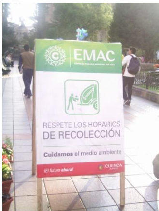
Día del no automóvil, Cuenca, Ecuador, 2010.

En la Etimología del plástico encontramos que el vocablo de este material deriva del griego plásticos, que se traduce como moldeable y que de acuerdo a la historia de este nos dice que el invento del primer plástico se originó como resultado de un concurso realizado en 1860, cuando se buscaba un reemplazante al marfil natural el cual se utilizaban para la fabricación de bolas de billar. En 1909 el químico norteamericano de origen belga Leo Hendrik Baekeland sintetizó un polímero de gran interés comercial, a partir de moléculas de fenol y formaldehído . Este fue el primer plástico totalmente sintético de la historia, fue la primera de una serie de resinas sintéticas que revolucionaron la tecnología moderna iniciando la «era del plástico». A lo largo del siglo XX el uso del plástico se hizo extremadamente popular y llegó a sustituir a otros materiales tanto en el ámbito doméstico, como industrial y comercial.