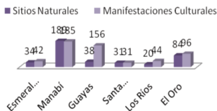
Gráfico 3. Clasificación de los atractivos turísticos por provincia

En cuanto a la definición de la propuesta metodológica, se planteó que ésta se componga de 4 etapas: 1. Planificación del inventario de atractivos turísticos, 2. Trabajo de campo y laboratorio, 3. Procesamiento, y 4. Análisis de la información. Se incluyen especificaciones en cuanto a la selección del equipo de trabajo, materiales e instrumentos de recolección de información, elaboración del cronograma de visitas, geo-referenciación de la información, productos a obtenerse, entre otros.