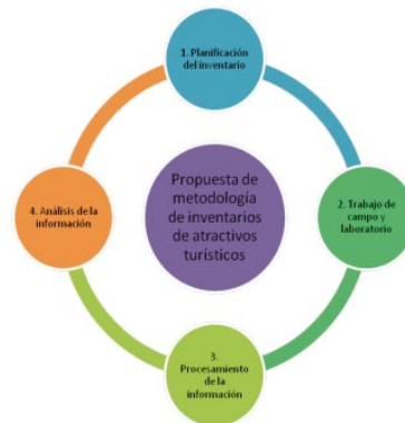
Gráfico 4. Propuesta de metodología de inventarios de atractivos turísticos

En cuanto a la definición de la propuesta metodológica, se planteó que ésta se componga de 4 etapas: 1. Planificación del inventario de atractivos turísticos, 2. Trabajo de campo y laboratorio, 3. Procesamiento, y 4. Análisis de la información. Se incluyen especificaciones en cuanto a la selección del equipo de trabajo, materiales e instrumentos de recolección de información, elaboración del cronograma de visitas, geo-referenciación de la información, productos a obtenerse, entre otros.