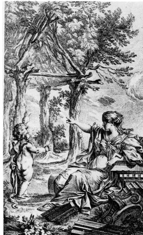
Fig. 2. Laugier. La Cabaña Primitiva. 1755

La mirada Ilustrada y Romántica hacia la relación entre la arquitectura y la naturaleza trató de evidenciar la temporalidad de las obras humanas, y sin embargo sirvió para reflexionar sobre la necesidad de su coexistencia, ya que el sentimiento de la naturaleza solo se nos abre a través del arte. Pero también el sentimiento de la ruina como retorno a lo natural llevaría a la cuestión de los orígenes, al instante en el que arquitectura y naturaleza formaban un mismo escenario a la búsqueda de una belleza natural. Rykwert en los años 70 estudió en profundidad el tema de la Cabaña Primitiva en su obra La casa de Adán en el Paraíso (1974), cuestión que a partir de Vitrubio fascino a los teóricos de la arquitectura desde Laugier a Semper y Viollet-Le Duc.