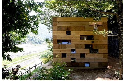
Fig. 4. Sou Fujimoto. Casa de madera definitiva. 2006-2008

la ciudad. Fujimoto quiere devolver a la gente la cabaña primitiva mediante un espacio similar a una cueva, sin mobiliario, escaleras ni suelos. Los ocupantes de la cueva se adaptan a ella, descubriendo capacidades múltiples de su utilización.