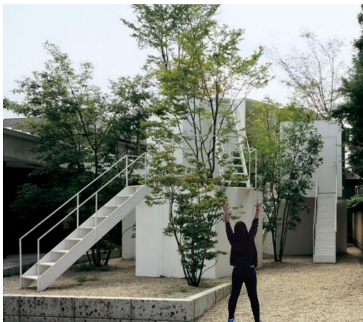
Fig 6. Sou Fujimoto. La Casa antes de la casa. 2007-2008

Otro ejemplo es la Casa antes de la casa (Figura 6), una nebulosa dentro de la ciudad formada por una agregación de elementos que configuran un paisaje urbano. Esta casa, que formó parte del proyecto Sumika, en el que se encargó a cuatro arquitectos diseñar un prototipo de vivienda con "un estilo de vida primitivo", fue construida en 2010 en el barrio de Utsunomiya en la prefectura de Tochigi. En él, Fujimoto propone una vivienda a modo de folie , formada por la adición contingente de diez cubos de chapa de acero blanca de entre 2 y 2,5 metros de lado, apilados unos sobre otros y conectados por escaleras. Esta topografía artificial crea la base de un paisaje vegetal formado por árboles que se desarrollan en las cubiertas de los cubos. Fujimoto (2008) describe el proyecto como "un lugar que es al tiempo casa, ciudad y bosque." (p.108). En los cubos hay dormitorios, estudio, baño, cocina, etcétera, y algunos que se utilizan como recinto para plantas. Un ámbito, medio natural, medio artificial, en el que se tiene la sensación de moverse por las ramas de unos árboles que hubieran invadido la arquitectura.