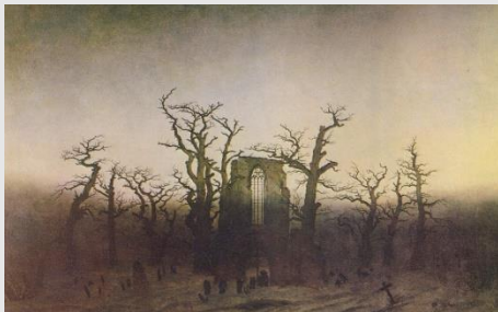
Fig. 1. C.D. Friedrich. Abadía en el robleal. 1809

En la cultura occidental, el concepto de Zeitgeist dominó las aspiraciones de universalidad de las obras artísticas. Cuestionado el modelo del Clasicismo, cada época debía de encontrar la verdad de sus producciones de acuerdo a sus aspiraciones culturales y sociales. Una verdad relativa ante el paso del tiempo que daba lugar a la transformación del pensamiento artístico y a la obsolescencia futura de cada una de las verdades encontradas. Para el pensamiento ilustrado y luego el Romántico, la ruina aparece como símbolo de la fugacidad, es el testimonio del impulso creativo del hombre pero también la huella de la subordinación a la cadena de mortalidad.