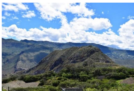
Figuras 8: Cerro Putushío, el Tablón, Saraguro, Loja.

La presencia y referencia de la tierra denominada “Verde Putushío” es marcada en el proceso de recopilación de las técnicas para la producción de pintura a base de pigmentos minerales. Este material es extraído del cerro Putushío (Figura 8), perteneciente a la provincia de Loja pero que colinda con el territorio del cantón Oña. La población tiene en su memoria gran aprecio y referencia por sus particulares características para la producción de pintura, siendo una tierra de color verde azulado claro con una textura similar a la cal.