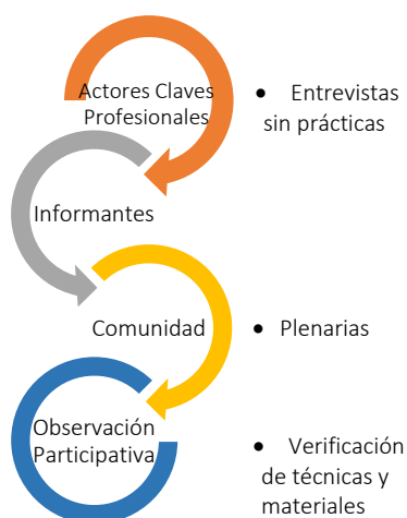
Figura 1: Esquema metodológico para recopilación de técnicas tradicionales de producción de pintura en Oña.

La participación de los actores territoriales permitió obtener resultados más específicos sobre el conocimiento intangible existente sobre la técnica y develar el método productivo de preparación de los pigmentos minerales. La figura 1 ilustra de manera detenida el proceso metodológico antes descrito.