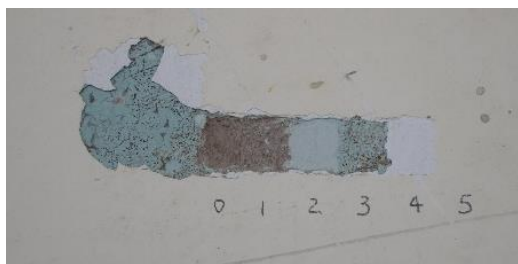
Figura 9: Cala de prospección en edificación de la cabecera cantonal. Oña, Azuay.