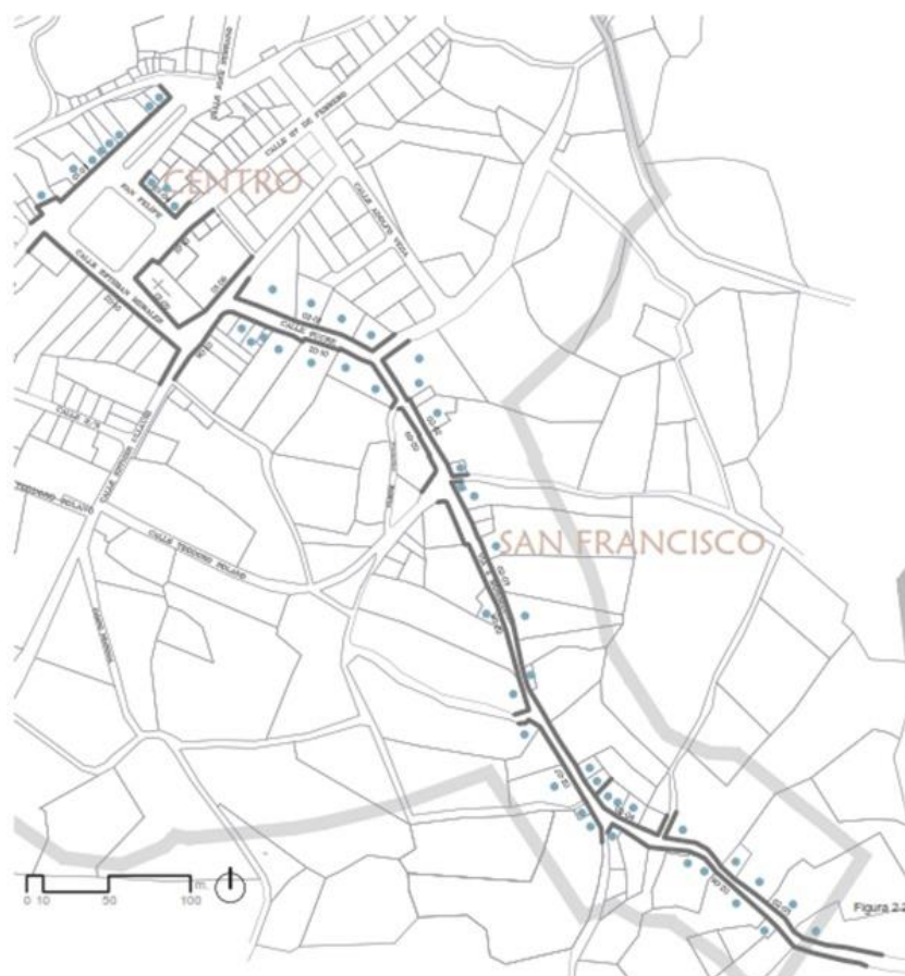
Figura 2: Mapa de ubicación de las edificaciones donde se realizaron calas de prospección de color. Oña, Azuay.

Como parte de la metodología, se estableció el reconocimiento de aspectos importantes en la historia de las técnicas y el color del cantón Oña, a través de calas de prospección 1 realizadas en los muros de las edificaciones. Las fuentes para establecer una muestra estratégica en las edificaciones sujetas a exploración por medio de las calas de prospección fueron: la historia de conformación del poblado y la cantidad de edificaciones vernáculas con muros y recubrimientos de tierra.