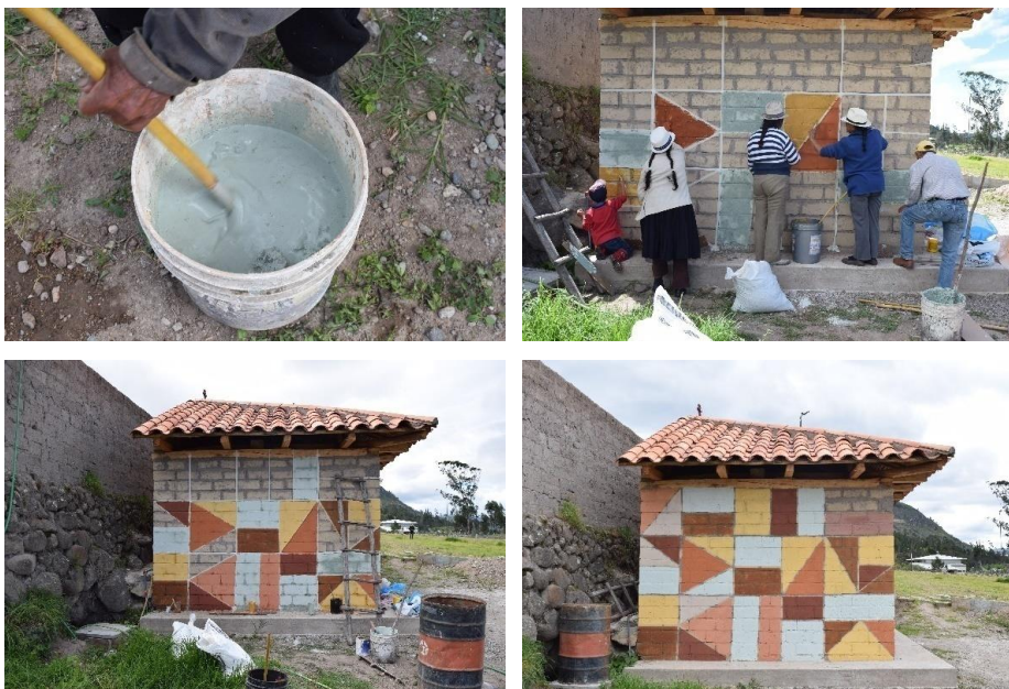
Figuras 4, 5, 6 y 7: Proceso de Observación participativa. Mural de reconocimiento de técnicas, Susudel, Azuay. 2016.

Además, se observó que la tierra utilizada como pigmento determina también propiedades especiales a la pintura sobre los muros de tierra. Estos pigmentos han sido identificados en base a métodos empíricos