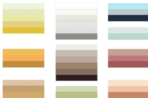
Figuras 10: Paleta de colores, resultado de las calas de prospección en los muros de edificaciones patrimoniales en la cabecera cantonal de Oña, Azuay.

La paleta de colores se definió a partir de todas las calas de prospección realizadas, por lo tanto no corresponde a ningún porcentaje, mayor o menor, en relación a cada color o momento histórico. Los colores más fuertes que se observan en la figura 10, posiblemente corresponden a pinturas industriales, ya que su condición y textura difiere de los demás tonos encontrados, que presentan tonalidades claras.