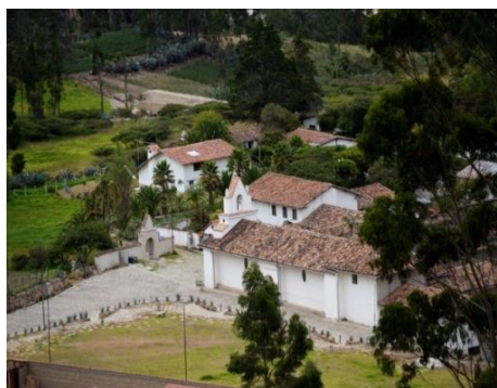
Figuras 11: Capilla colonial de Susudel (1752).

La elaboración y aplicación de pigmentos minerales en el cantón Oña ha formado parte del legado de saberes que sus moradores ejercían desde la época de la colonia, y donde el patrimonio monumental y sobrio del territorio son claros testigos de dicha riqueza cultural, ya que tanto iglesias (Susudel y Oña) y algunas casas en Oña mantienen todavía vigente la aplicación de las pinturas minerales en sus fachadas.