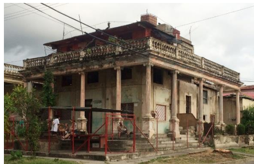
Figura 1: Comparación entre modelo virtual de la composición estético-formal original de la edificación y su situación actual. Un ejemplo de la pérdida de componentes e inserciones inadecuadas que resultan en alteraciones a tipologías arquitectónicas tradicionales características de áreas patrimoniales de Santiago de Cuba (2017).