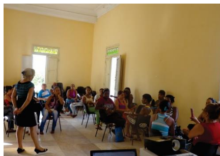
Figura 2: Durante las sesiones de trabajo con maestros de escuelas primarias en el curso de capacitación sobre patrimonio cultural (2016).

Otra forma de contribuir con el reforzamiento del compromiso social ante los bienes patrimoniales es a partir de la educación y creación de capacidades en líderes comunitarios. La labor desarrollada por estudiantes que integran la Asociación de Estudiantes en Defensa del Patrimonio (AEDP) de la Universidad de Oriente vinculado al trabajo directo con niños en escuelas primarias es un antecedente de las acciones que se desarrollan actualmente. Entre ellas se llevó a cabo un curso de entrenamiento en patrimonio cultural con enfoque interdisciplinar para maestros de educación primaria, cuya misión posterior es favorecer la implementación de estrategias de educación patrimonial en edades tempranas. (Figura 2) De la misma manera se concibió un plan para la capacitación de líderes comunitarios en la temática del patrimonio cultural. Los resultados de estas experiencias serán difundidos en futuras publicaciones.