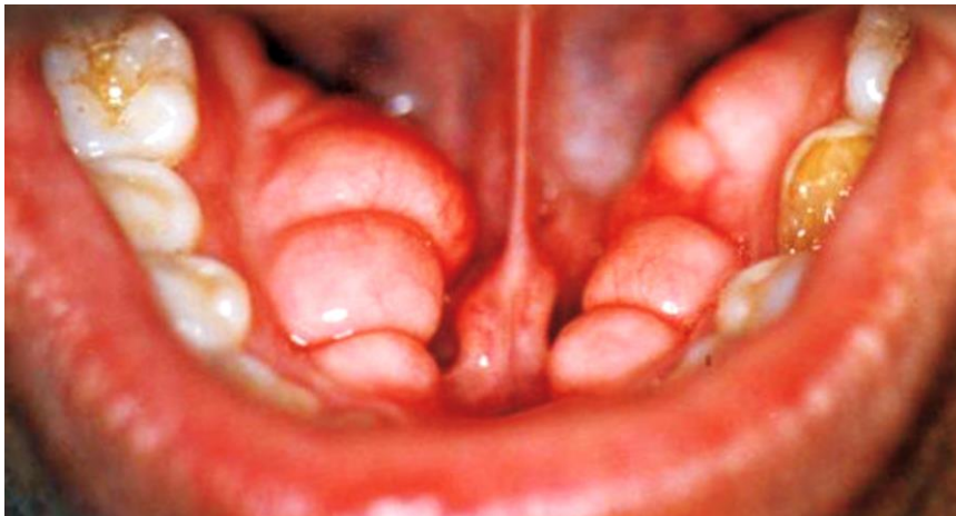
Figura 6: Torus mandibular bilateral múltiple 29