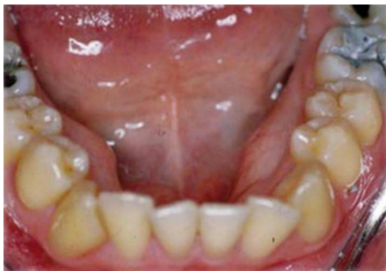
Figura 7: Torus mandibular bilateral único 8