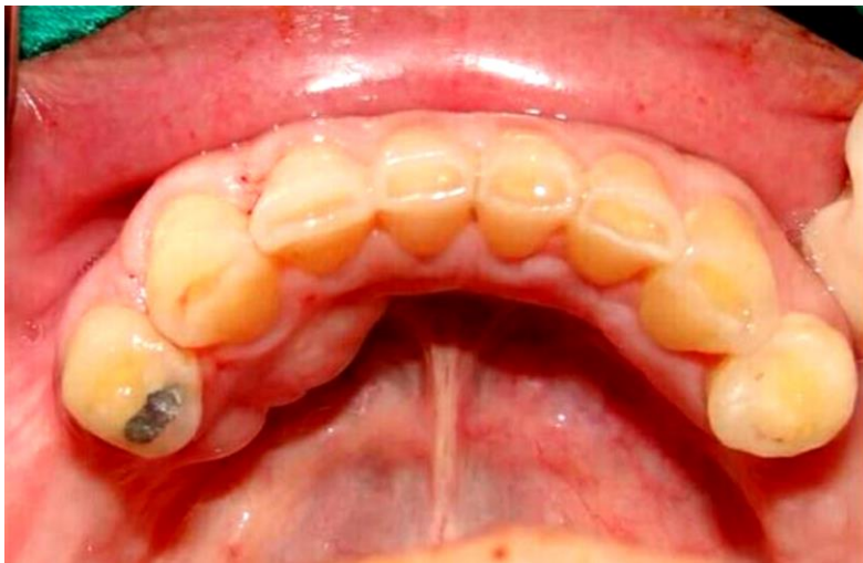
Figura 5: Torus mandibular unilateral múltiple 28