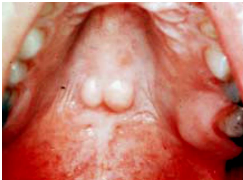
Figura 3: Torus palatino nodular 22