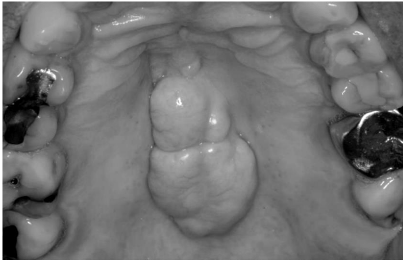
Figura 4: Torus palatino lobular 25