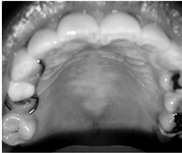
Figura 2: Torus palatino plano 25