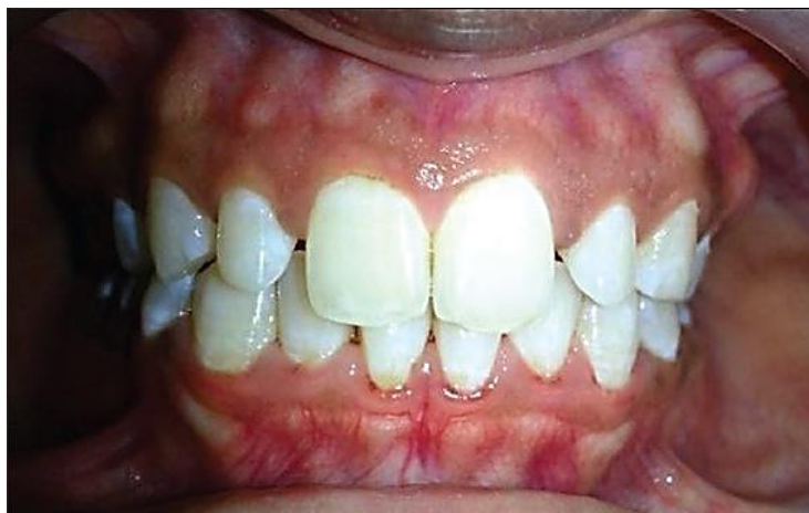
Figura 1. Exostosis vestibulares 2

Radiográficamente se observan como masas radiopacas difusas dentro de los huesos maxilares. 22