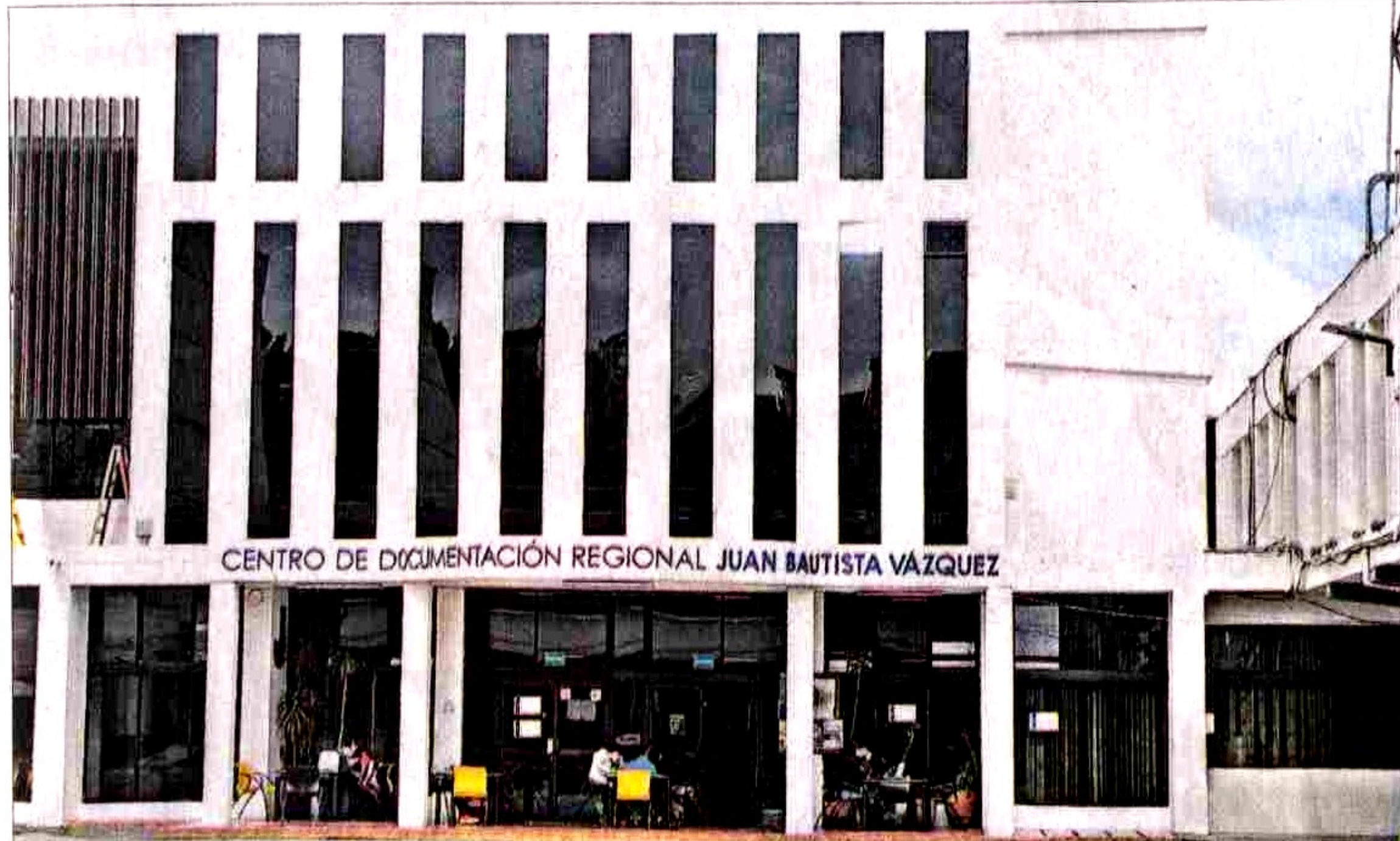
Sede del Centro de Documentación, que se halla en remodelación.