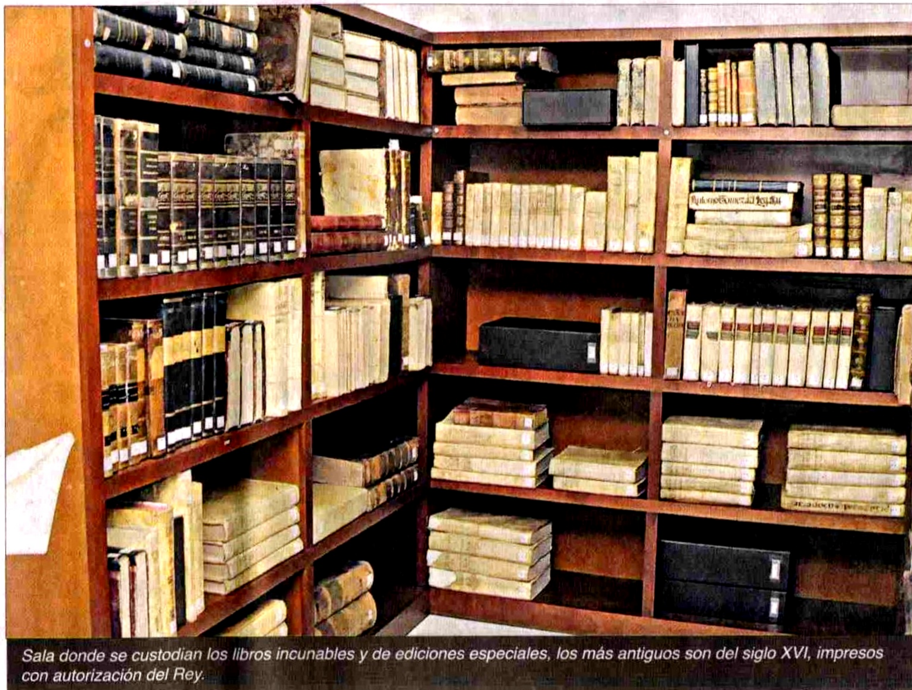
Sala donde se custodian los libros incunables y de ediciones especiales, los más antiguos son del siglo XVI, impresos con autorización del Rey.

El obispo José Ignacio Ordóñez, de paso para Europa, llevó el dinero para pagar los libros.