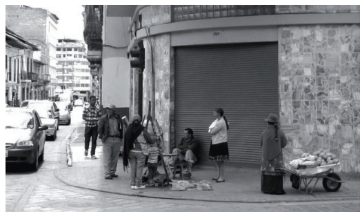
Imagen 3: Fuera de las áreas inmediatas al Parque Calderón los comerciantes ocupan temporalmente lugares con afluencia de personas para asegurar su subsistencia. El comercio ambulante tiene una larga trayectoria en el país, es protagonizado mayoritariamente por mujeres y con frecuencia involucra a niños.