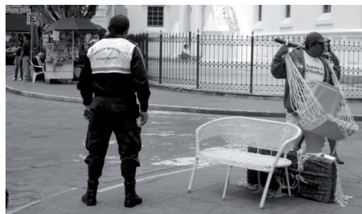
Imagen 2: Los manzanos adyacentes al Parque Calderón se han restringido para ciertos tipos de comercio ambulante. La policía municipal obliga a los comerciantes a retirarse.