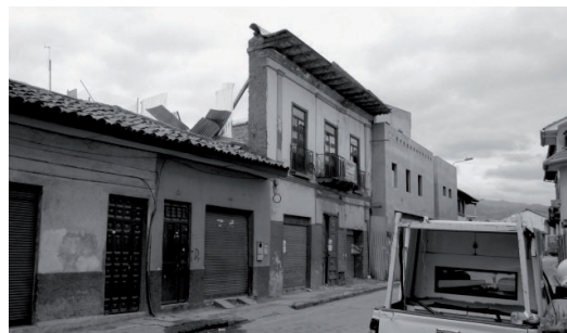
Figura 7: La transformación radical de viviendas manteniendo sólo el muro de la fachada (fachadismo) es una práctica que sigue dando en Cuenca, aún cuando es sancionada. Los nuevos edificios no siempre hacen uso de materiales similares. La interacción de la nueva arquitectura con la morfología del contexto es un tema discutible aunque rara vez abordado.