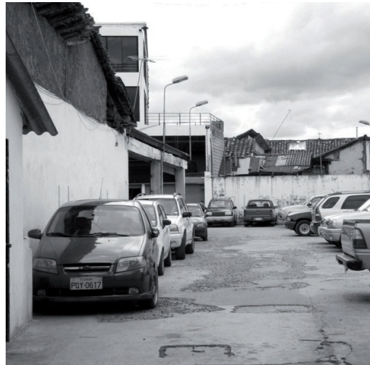
Figura 5: Parqueadero de la calle Juan Montalvo, en el barrio La Cruz del Vado, Cuenca.

Ahora, es el capital cultural el que se reconoce como recurso en varios niveles, pero cuya recursividad es menos cuantificable y más cualitativa. El trabajo de Pillai emplea un marco conceptual robusto y un enfoque basado en las interacciones entre la comunidad y el sitio, como punto de partida para estudiar el conocimiento cultural y su acumulación como capital cultural. Los conceptos que emplea este enfoque están fuertemente articulados y a ellos se incorpora el abordaje de la dimensión espacial de los patrones físicos, sociales y de subsistencia de los asentamientos habitados (Ver Imagen 4). No se descartan otros estudios en el campo cultural que buscan evidenciar la relación cultura-desarrollo y, al mismo tiempo, establecer metodologías para su manejo 29 . La aproximación basada en evidencias, sin embargo, es de una complejidad mayor que involucra componentes subjetivos