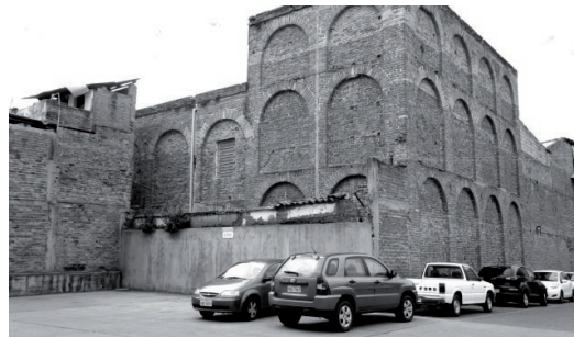
Figura 6: Corazón de manzana utilizado como parqueadero en Cuenca.