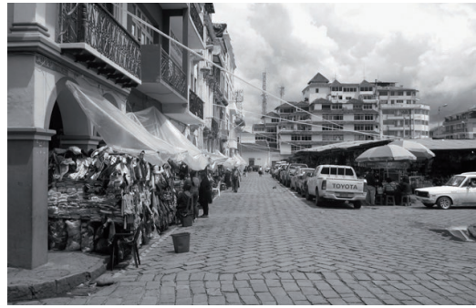
Imagen 1: Comerciantes de la Plaza de San Francisco en Cuenca. Al final de la administración (2009-2014), agentes municipales intentaron desalojar a los comerciantes. El programa para la 'recuperación' de la plaza preveía su reubicación en el subsuelo y la implementación de un estacionamiento público subterráneo.

En las ciudades del Ecuador, como Guayaquil y Quito, numerosos estudios de autores locales e internacionales demuestran que procesos culturales como el blanqueamiento informan a las políticas urbanas vigentes para los centros históricos y se revelan en estrategias de revitalización y renovación urbana acompañadas por políticas de cero tolerancia e higienismo racial implementadas en muchos casos de manera violenta. El mestizaje y el blanqueamiento, son claramente legados coloniales que permanecen como ideologías dominantes en grupos influyentes sobre la gobernanza, animando una visión de lo indígena como lo primitivo a ser superado y a evolucionar hacia formas de ser "más civilizadas" 23 .