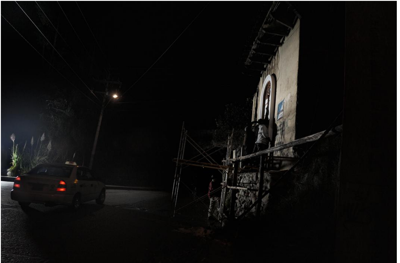
Imagen 9. Secuencia 5 de “La Luz Restauradora”