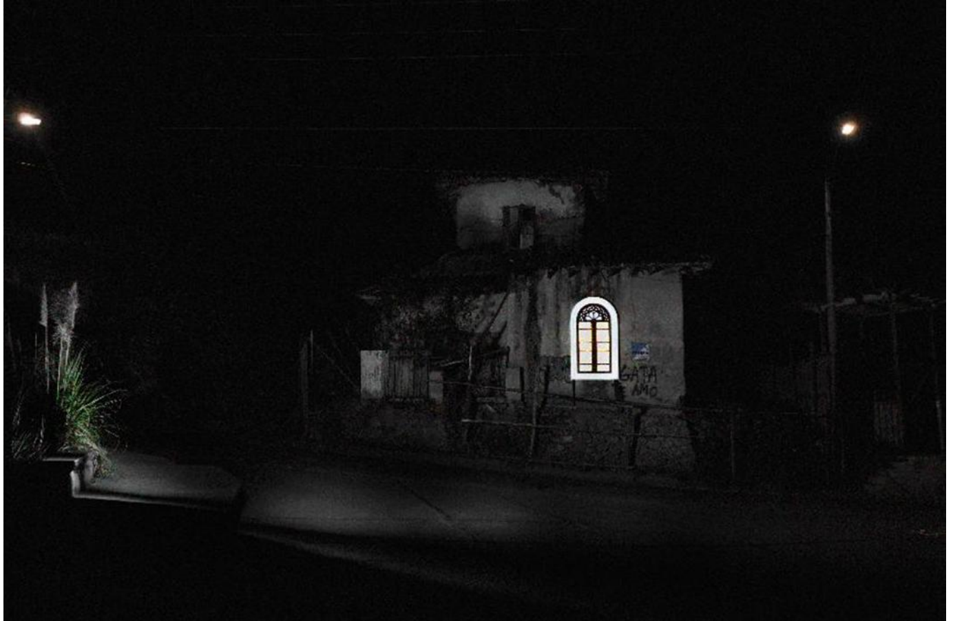
Imagen 12. “La Luz Restauradora” fin de la obra