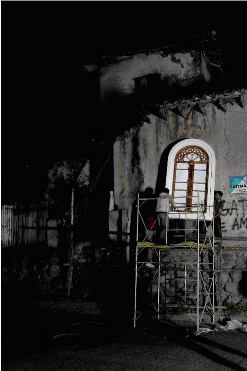
Imagen 11. Secuencia 7 de “La Luz Restauradora”