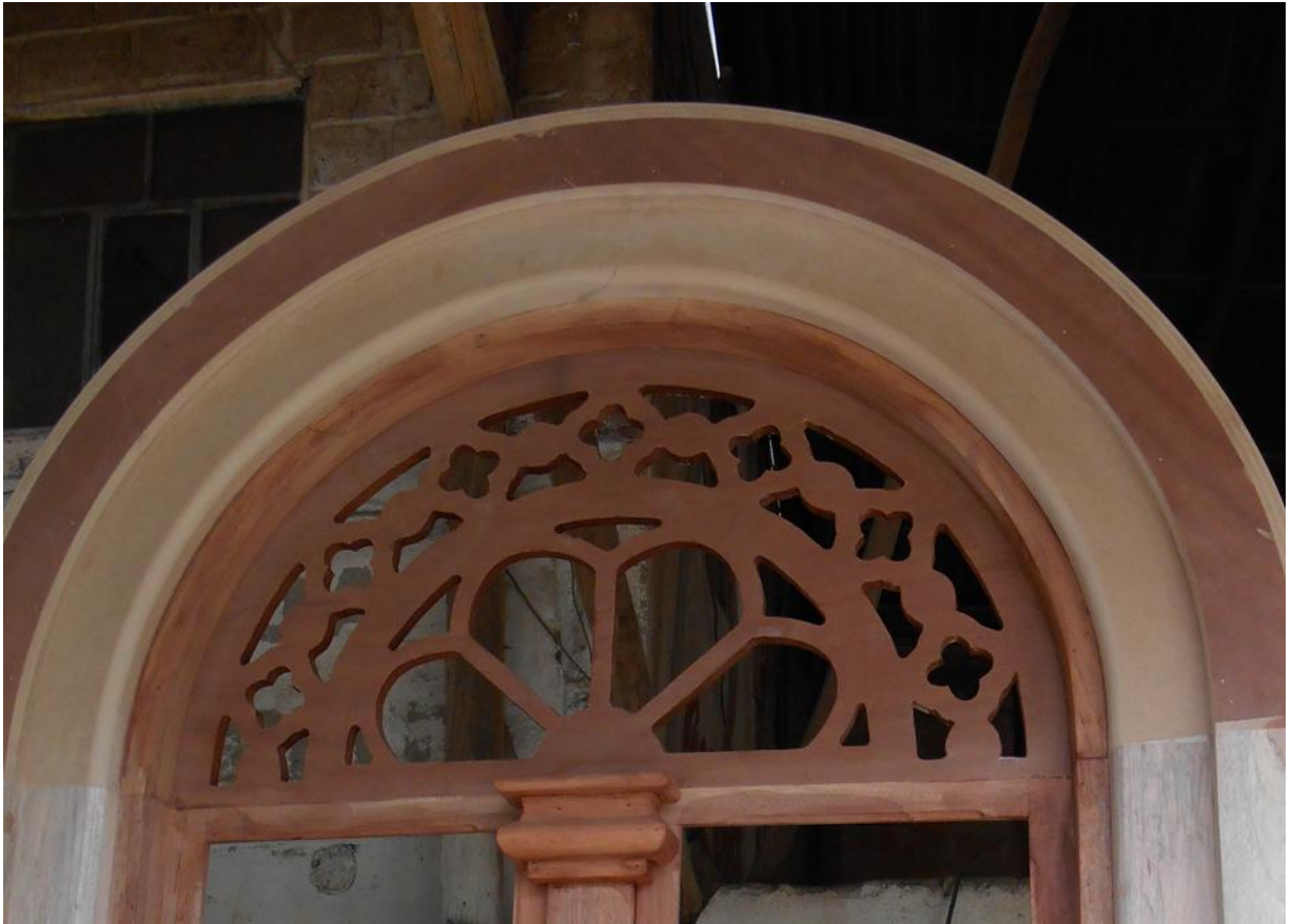
Imagen 2. Detalle superior de la ventana en madera Fuente: Alcívar, Aníbal. (Cuenca, 2015)