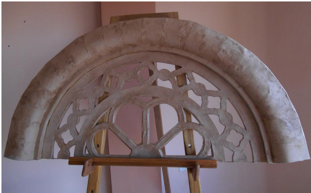
Imagen 1. Detalle de la maqueta en cartón

Se detalla en las siguientes páginas un ejemplo de la maqueta realizada en cartón, para que luego el artesano carpintero que colaboró en mi proyecto pueda copiar el modelo en tamaño natural. Se adjunta el modelo terminado en madera por Luis Salinas (carpintero).