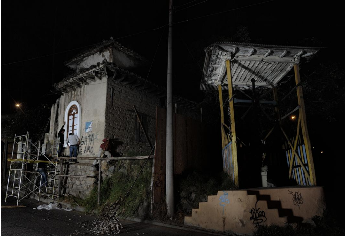
Imagen 7. Secuencia 3 de “La Luz Restauradora” Fuente: Piedra, Fernando (fotógrafo). (Cuenca, 2015)