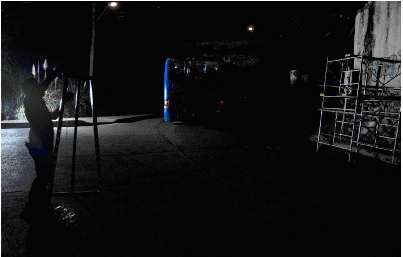
Imagen 5. Secuencia 1 de “La Luz Restauradora” Fuente: Piedra, Fernando (fotógrafo). (Cuenca, 2015)

Los site-specific tienen la particularidad de ser una actividad artística efímera, la cual sucede en un espacio y tiempo determinados, hoy ya no existe, pero el recurso fotográfico nos ayuda a que perdure en el tiempo mostrando el carácter de la obra. Como sustento de esta investigación se presentará la siguiente secuencia de imágenes como respaldo del tema analizado.