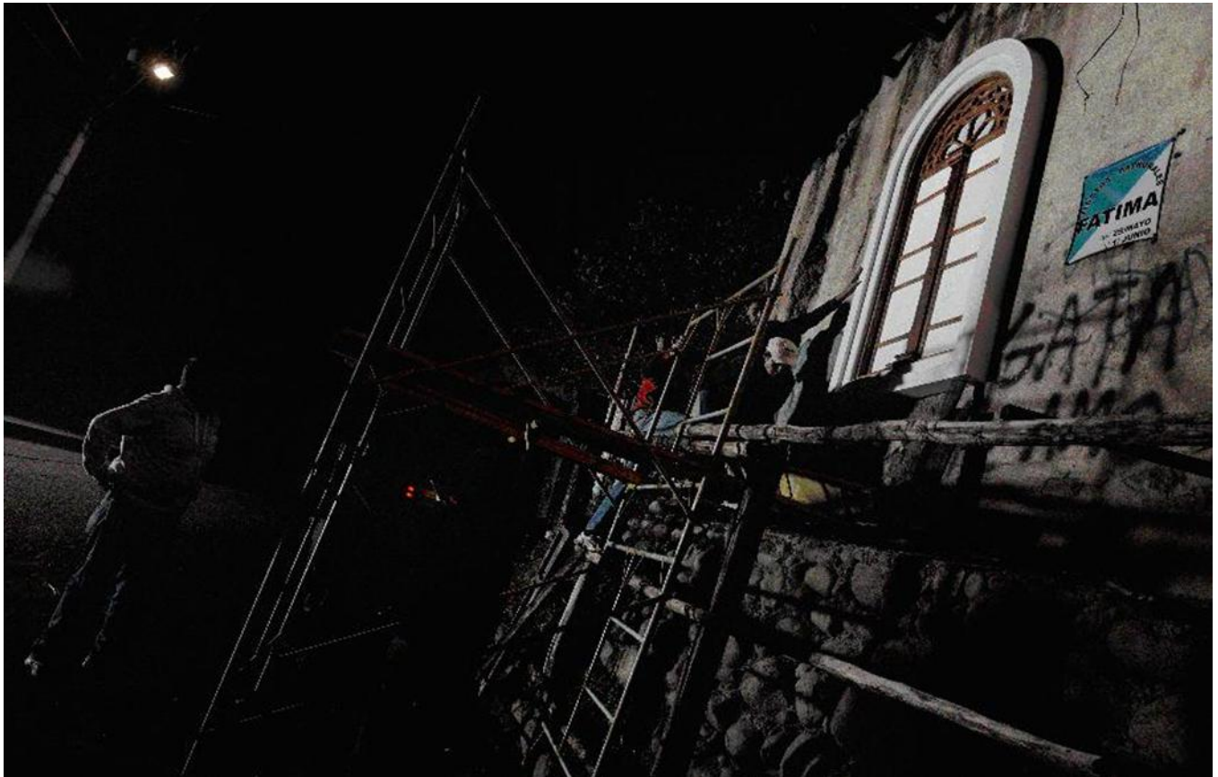
Imagen 8. Secuencia 4 de “La Luz Restauradora”