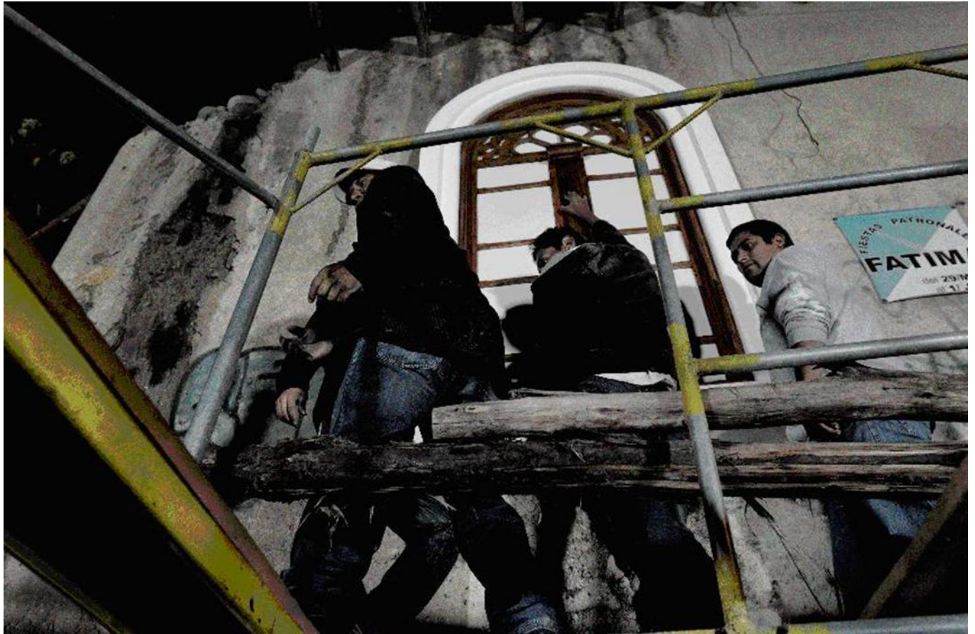
Imagen 10. Secuencia 6 de “La Luz Restauradora” Fuente: Piedra, Fernando (fotógrafo). (Cuenca, 2015)