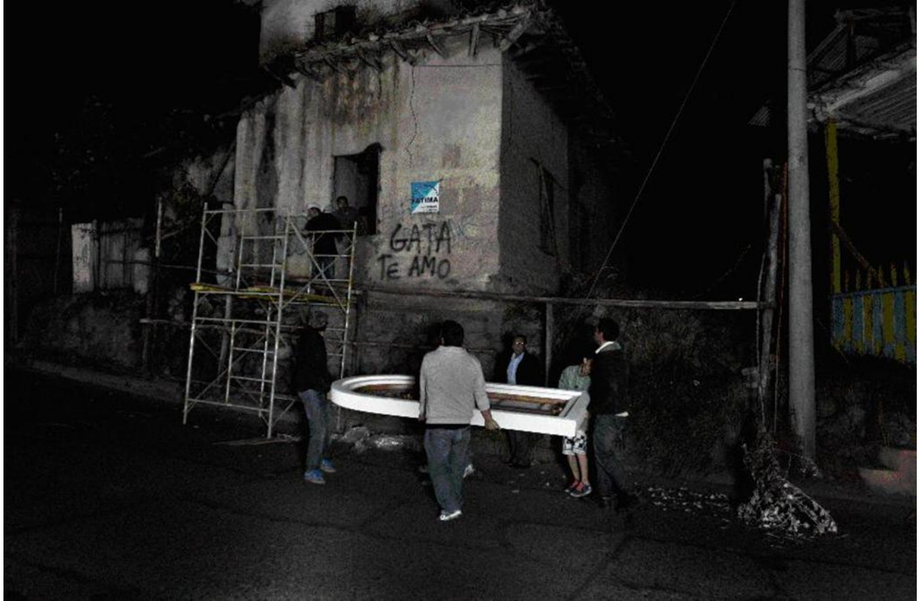
Imagen 6. Secuencia 2 de “La Luz Restauradora” Fuente: Piedra, Fernando (fotógrafo). (Cuenca, 2015)