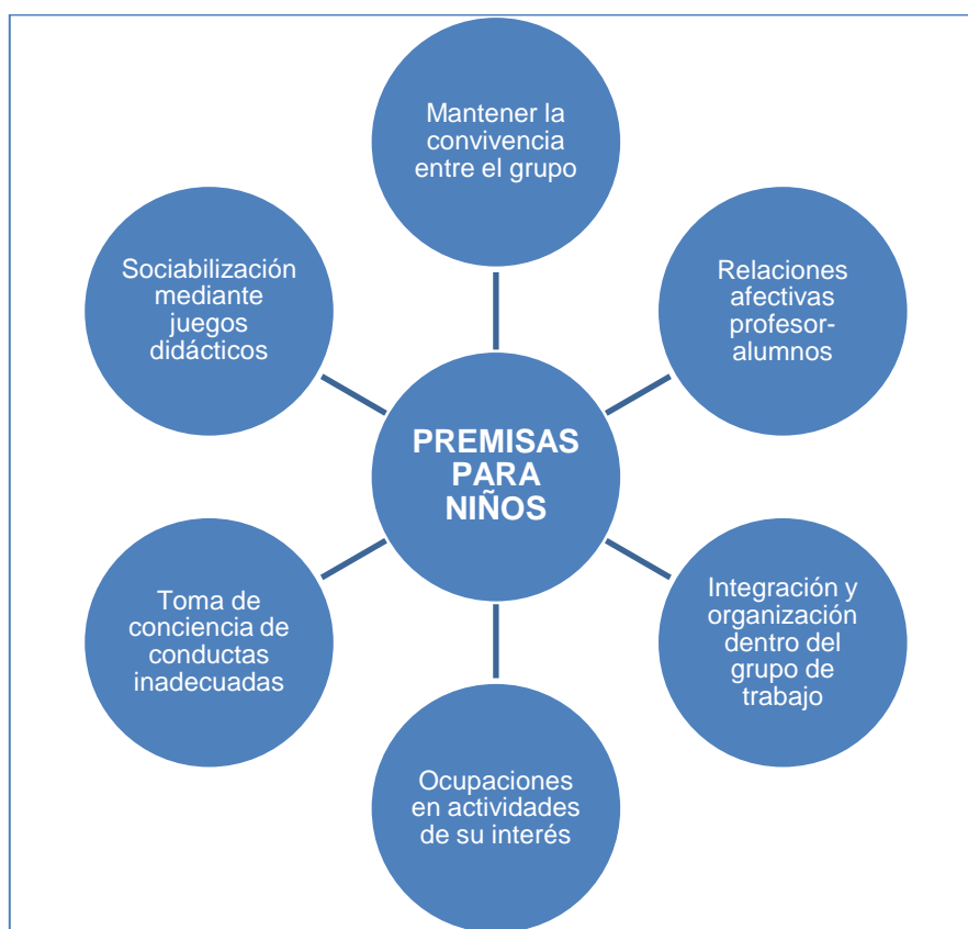
Figura 4.: Premisas para los niños y niñas