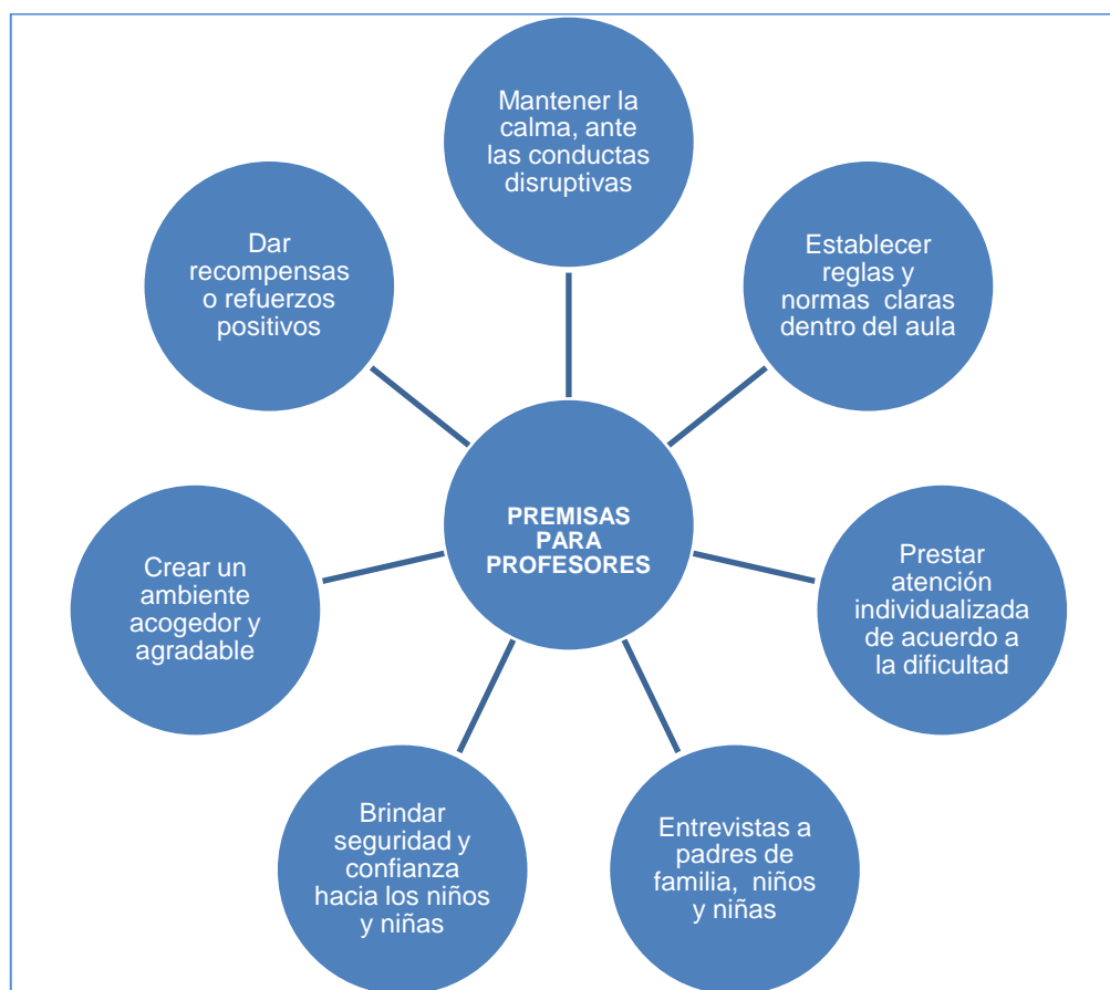
Figura 3.: Premisas para los profesores