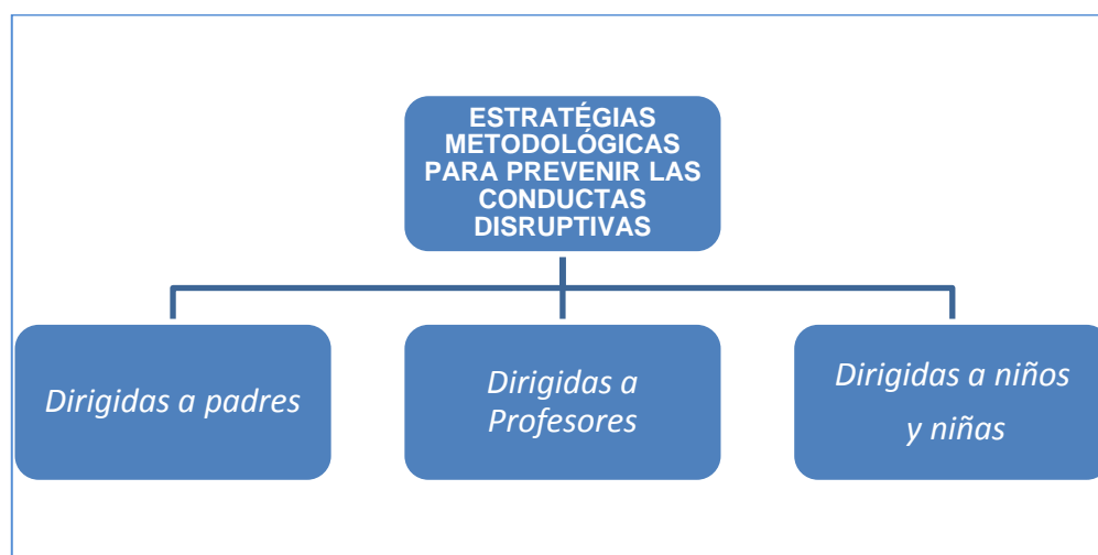
Figura 1.: Estrategias metodológicas de prevención de las conductas disruptivas

ámbitos ( familiar, escolar y social ). Por medio de las intervenciones se obtendrá una mejora en las relaciones interpersonales entre alumnos, entre profesores, entre profesores-alumnos y entre padres-profesores, y entre padres-alumnos, la mejora del clima del centro y del aula, así la intervención garantizará una sana convivencia, en definitiva una nueva educación que pase por una educación en valores.