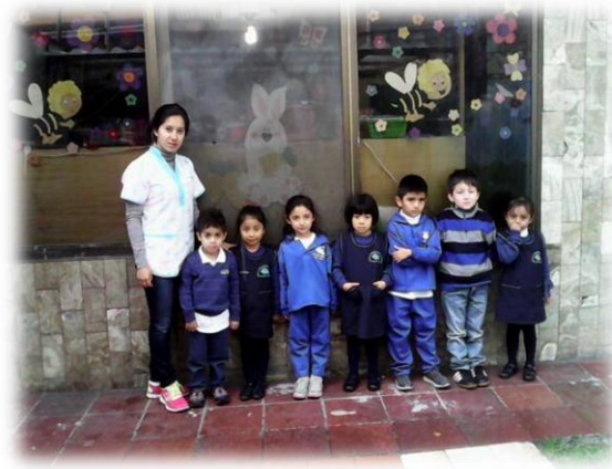
Centro Particular Infantil “Creciendo Libres”. Vista lateral. Responsables: Autoras.