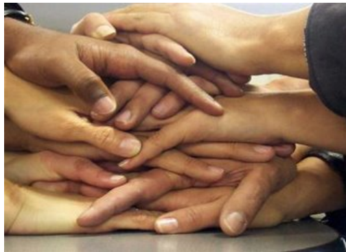
Imagen No 9

Entendemos por trabajo grupal, a una propuesta que implica una participación más activa de los alumnos como sujetos de aprendizaje, a partir de una experiencia grupal, y este a su vez genera vínculos entre quienes participan, (docentes, alumnos ). Favorece el cambio en la práctica educativa para formar en los estudiantes actitudes y habilidades de pensamiento