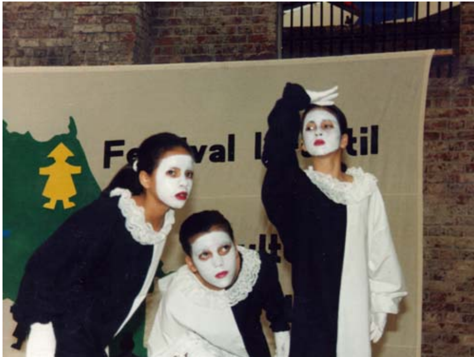
Imagen No 11

El teatro de aula es una estrategia pedagógica, lúdica, pretende potenciar cualidades como la expresión corporal, la memoria, el sentido espacial o la sensibilidad, en el teatro del aula todos los participantes han de ser protagonistas y autores porque es flexible y elástico y se valoran todas las opiniones.