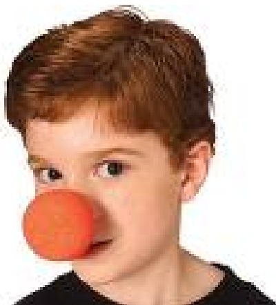
Imagen No 8