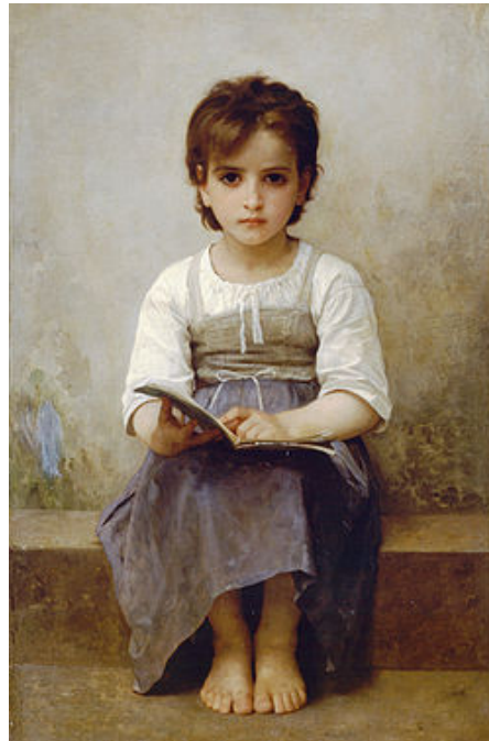
Imagen No 6

En la práctica educativa, desde el punto de vista pedagógico, podríamos afirmar la importancia de utilizar el arte dramático en el aprendizaje de los niños, porque ellos lo aceptan con alegría como una actividad que equilibra la carga docente a la que están “sometidos”. El arte dramático en el aprendizaje permite a los niños desarrollar su pensamiento, adquirir hábitos de disciplina, de conducta social, al mismo tiempo que satisfacen sus necesidades físicas y espirituales.