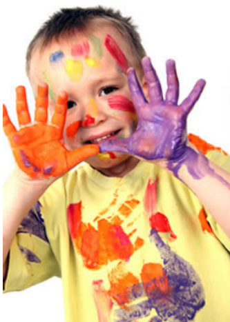
Imagen No 2

La creatividad en los niños y niñas, es una actividad innata y el objetivo del docente es ayudarlo a descubrir ideas nuevas y maneras diferentes de ver las cosas, la creatividad debe ser estimulada mediante el acompañamiento en el juego y no únicamente proporcionarle material y esperar que el niño sea un pensador creativo.