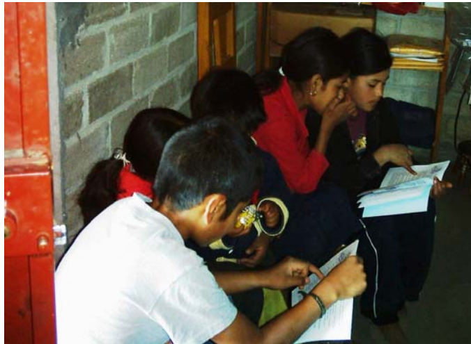
Imagen No 7

Para acercarnos al concepto de la comprensión lectora, debemos saber cuales son los componentes necesarios y los pasos a seguir para llegar a esta, por tanto debemos saber primero: