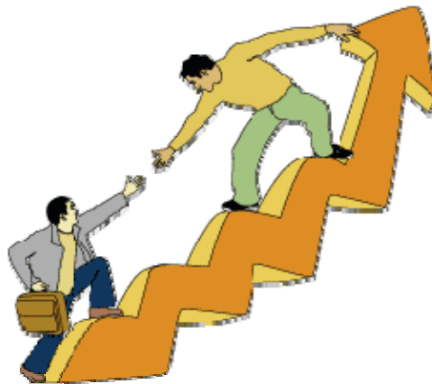
Imagen No 5

Sera necesario entonces, que la escuela se adapte al alumnado y no lo contrario, si es que de verdad queremos su participación. Al mismo tiempo, debemos mostrar nuestra estimación hacia ellos y hacia su esfuerzo, ya que se ha comprobado una correlación positiva entre el rendimiento, el auto-concepto y muy ligado a este las expectativas mostradas por el maestro.