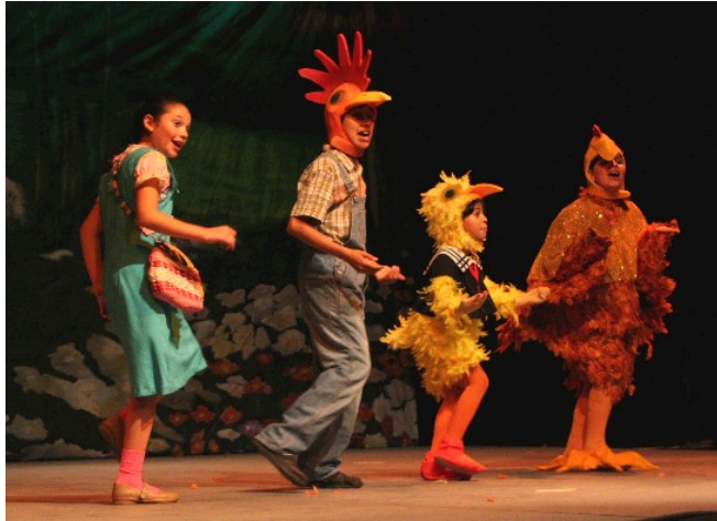
Imagen No 1

Con el arte dramático, el niño conoce “su propio mundo”, un mundo lleno de realidades y fantasías objetivas y subjetivas por medio de los diferentes géneros, contribuyendo en gran medida a su proceso de socialización; permitiéndole la integración con sus pares y promoviendo el mutuo aprendizaje, ya que ellos enseñan por medio de las artes escénicas y aprenden a través de ellas.