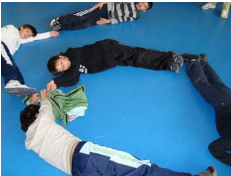
Imagen No 13

La expresión corporal, es una disciplina aplicable en la labor educativa, en la que busca caminos de conocimiento de sí mismo, de comunicación con los demás, y nuevas vías de expresión en el arte del cuerpo. El trabajo corporal desarrolla una sensibilización en el niño en donde integra la consciencia del cuerpo con la vivencia del mismo.