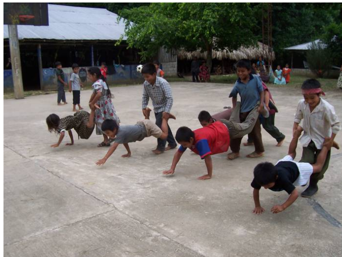
Imagen No 10

El juego permite a los niños familiarizarse con el mundo que los rodea, es una actividad indispensable en él, porque es la expresión de sus necesidades, sentimientos, emociones, vivencias, problemas, etc., manteniendo una estrecha relación con el desarrollo de la personalidad.