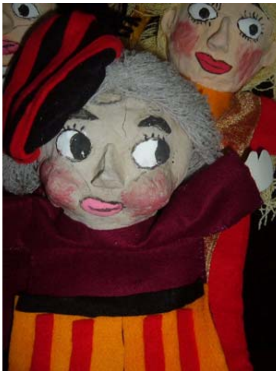
Imagen No 12

Los títeres, son un recurso para ser utilizado en el aula, cuando el maestro crea oportuno o cuando los niños estén motivados para hacerlo. Los títeres permiten crear un ambiente lúdico para dinamizar los aprendizajes y también para hablar de temas que a los niños les cueste comunicar.