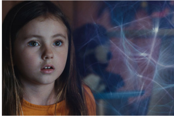
Imagen No 3

En la imaginación de cualquiera aparecerán entonces representados generalmente todos aquellos personajes, objetos, emociones, entre otros, más representativos para la persona y que son los que en definitiva más despiertan su interés, es decir, en los peores de los casos tendemos a imaginarnos cosas feas, horrosas, repulsivas, mayormente, el mecanismo de la imaginación buscará imaginar aquellas cosas queridas, añoradas.