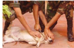
Foto- militares degollando a perro para comérselo

Como agresiones podremos llamar los bloqueos económicos, las invasiones militares en otros países, las bases militares impuestas por intereses disfrazados de buenas intenciones cuando en realidad es para el control de sublevaciones.