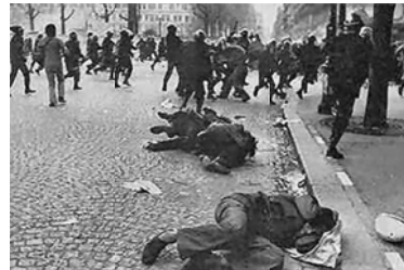
Foto-REPRESIONES EN VENEZUELA

Aunque el auto no aparece ha quedado la huella de poder al pasar por encima del animal que por su desorientación y desconocimiento de las reglas o leyes del lugar sucumbido ante la agresión del poder de su victimario.