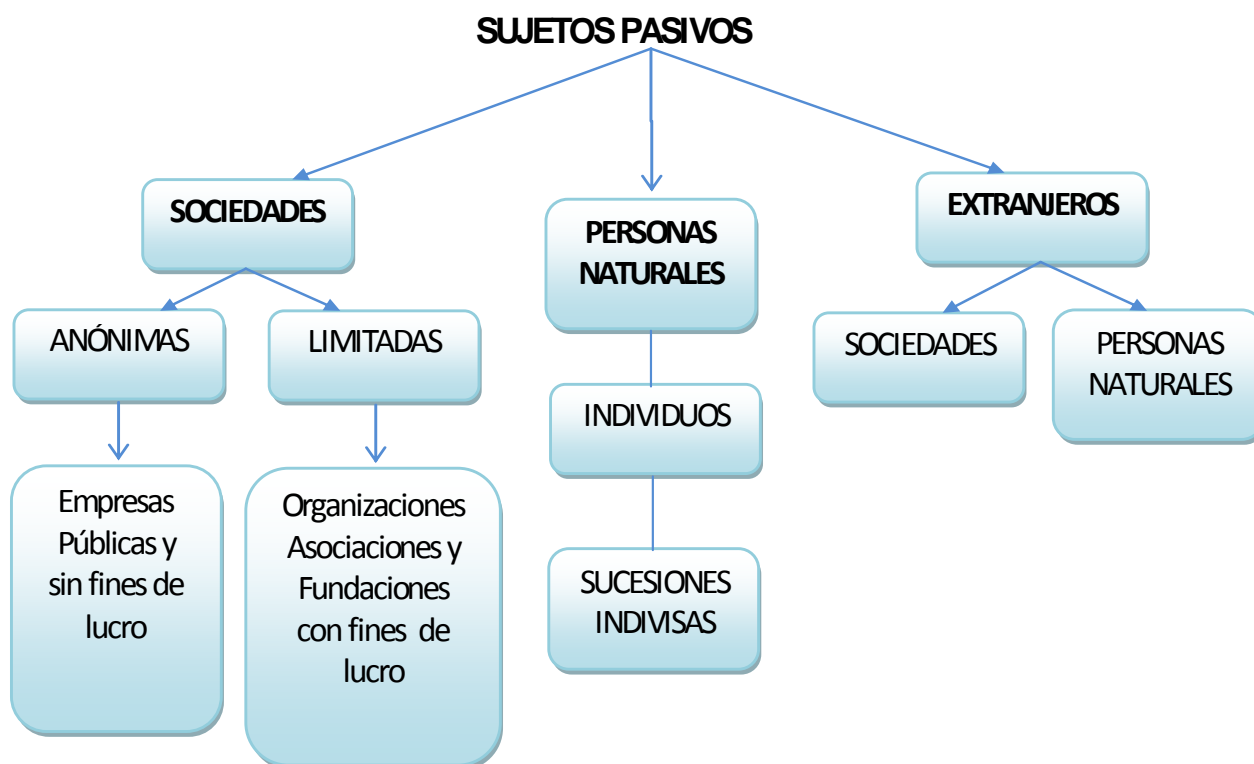
Figura N° 1 Clasificación Sujetos Pasivos

El Sujeto Pasivo de la obligación tributaria es el contribuyente o responsable del tributo, a quien el Estado o entes menores pueden exigir el pago o el importe del tributo.